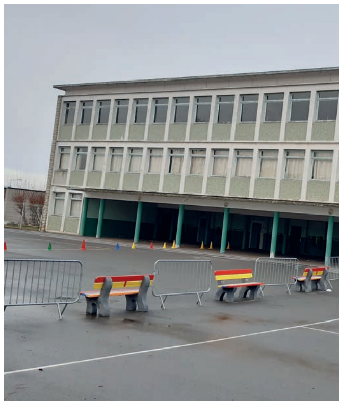
École du Moulin